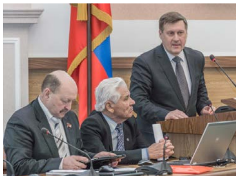
Мэр г. Новосибирска Локоть А.Е. приветствует участников

В проведении мероприятий Отделения активно участвуют руководители города, политики и общественность города.