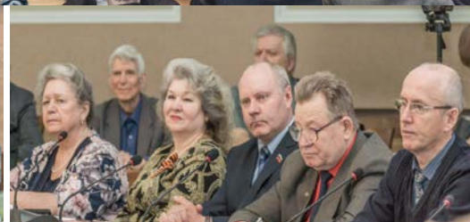
Годичное собрание, посвященное 70-летию Победы в Великой Отечественной

С 1995 года Отделением издаётся бюллетень «Вестник Новосибирского отделения ПАНИ», в котором, наряду с материалами членов ПАНИ и других учёных, публикуются памятные статьи, а также хроника жизни Отделения. К настоящему времени издан 21 номер Вестника. В 2016 году сделана успешная попытка публикации работ членов ПАНИ под эгидой издания бюллетеня НО ПАНИ. Начиная с 20-го номера, в сборнике появился литературно-художественный раздел, что заметно повысило интерес к сборнику, его читабельность и востребованность.